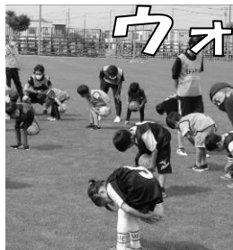
ウォーミングアップ